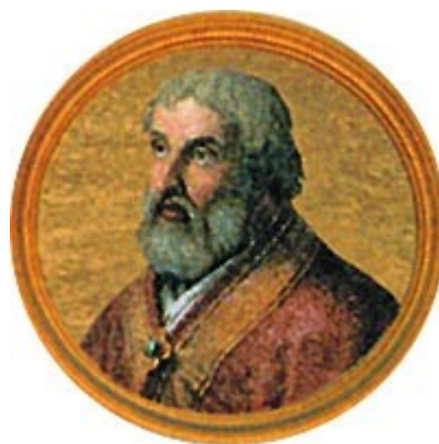
Sergio IV + 12 maggio 1012